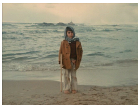
Un long travail sur les enfants de la guerre au Liban.